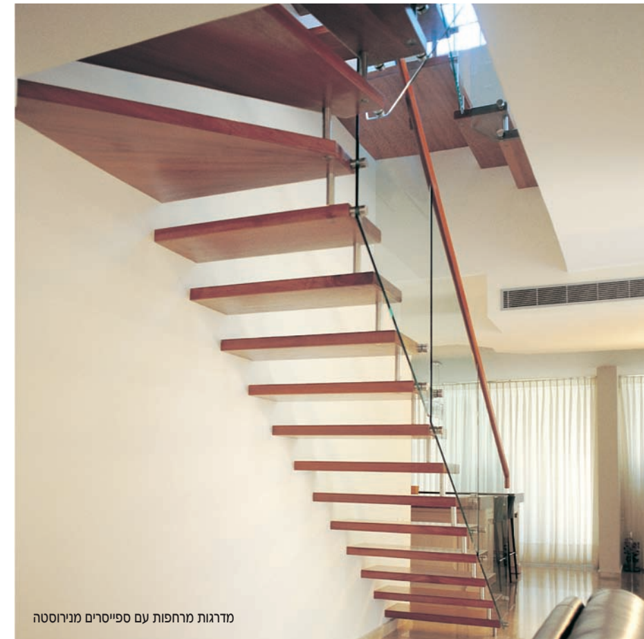
מדרגות מרחפות עם ספייסרים מנירוסטה