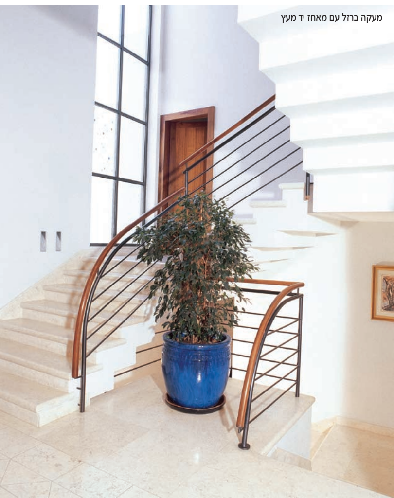
מעקה ברזל עם מאחז יד מעץ