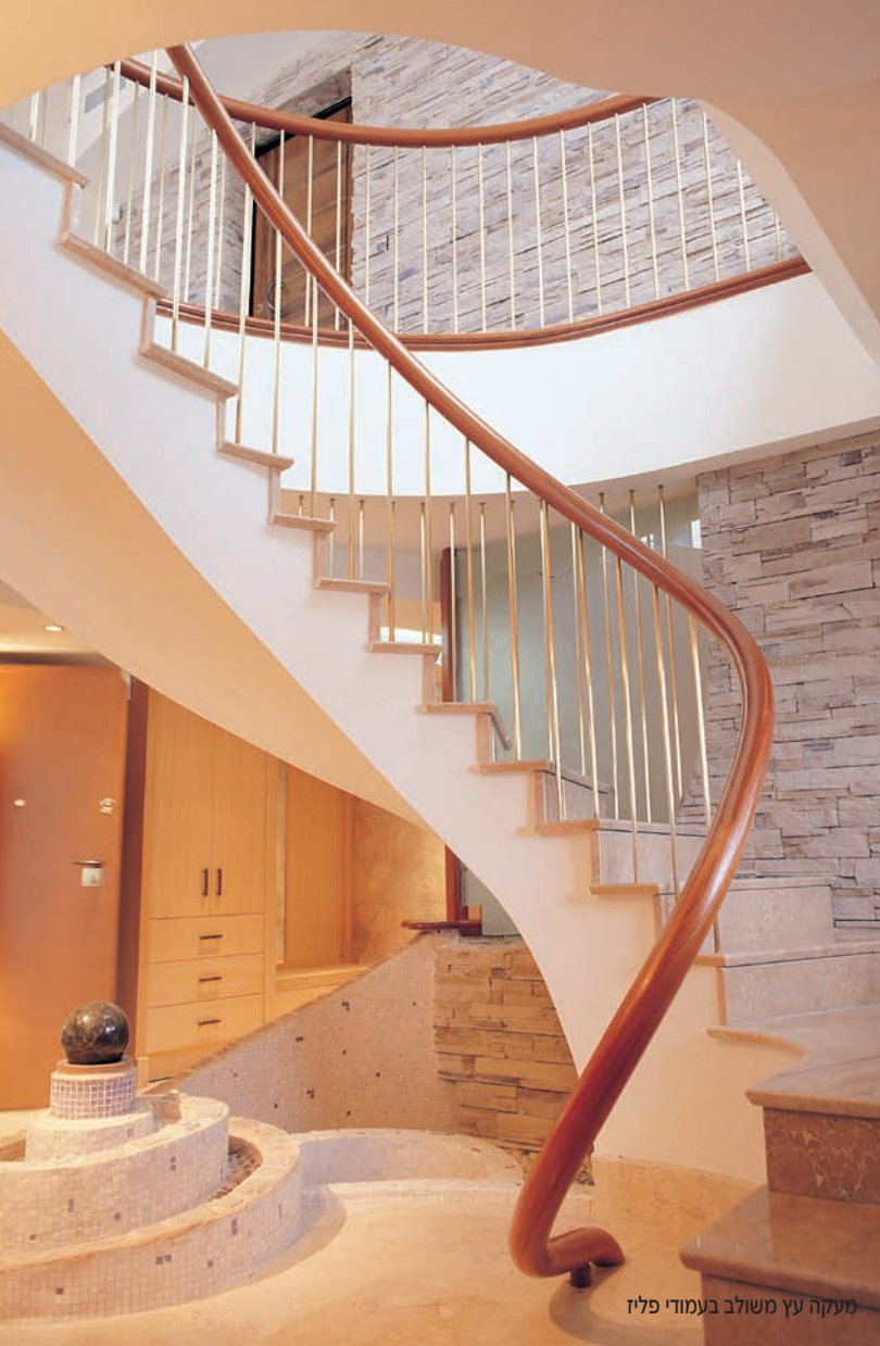
מעקה עץ משולב בעמודי פליז