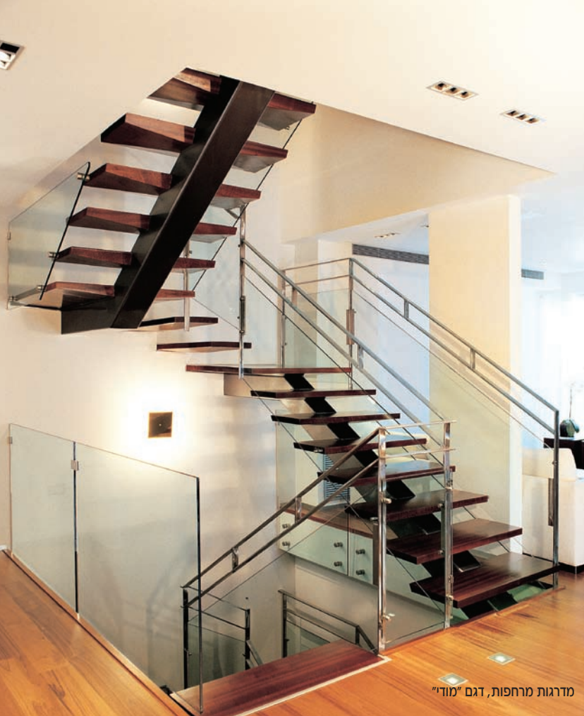
מדרגות מרחפות, דגם "מודי"

אך המוצר הסופי הוא רק חלק מתהליך כולל, רחב-יריעה, שבבסיסו שירות אישי. כך למשל, ההתקנות עצמן מתבצעות על ידי צוותי הרכבה מיומנים המלווים באחראי צוות צמוד. אחראי הצוות מספק, במידת הצורך, מענה ופתרונות יצירתיים ומיידים לאתגרים שעשויים לצוץ במהלך העבודה.