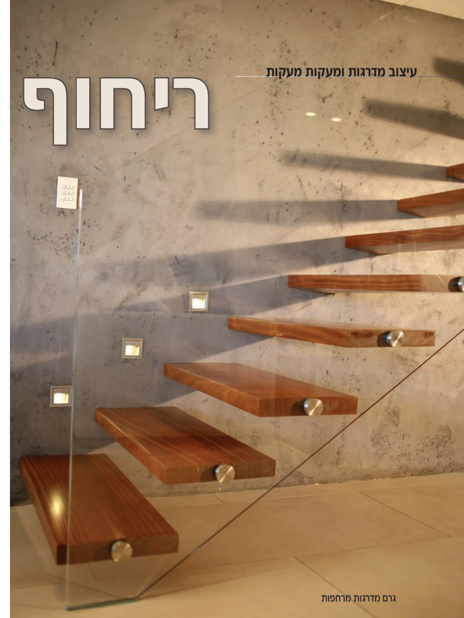
גרם מדרגות מרחפות