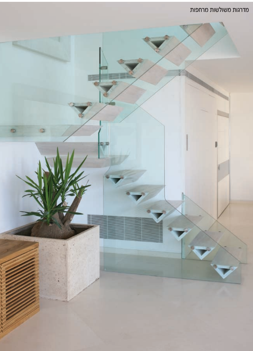
מדרגות משולשות מרחפות

באתר החברה ( www.maakot.co.il ) ניתן למצוא דוגמאות לשפע של מוצרים וסגנונות.