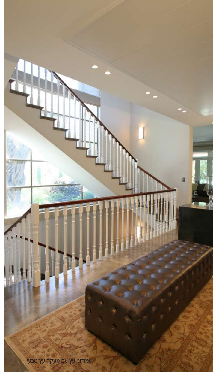
עמודי עץ עם מעקה עץ טבעי